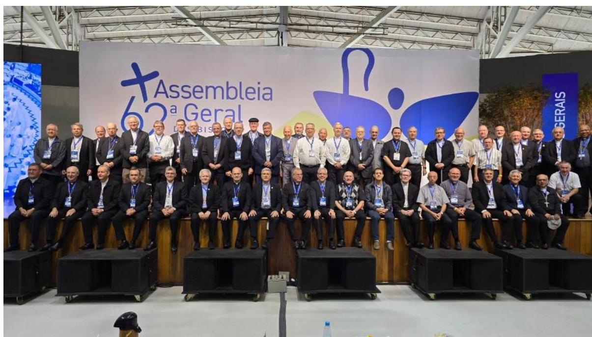
1 - Foto: Pascom Regional Sul 1 da CNBB.

Assembleia da CNBB é concluída com novas diretrizes e mensagens à Igreja e à sociedade.